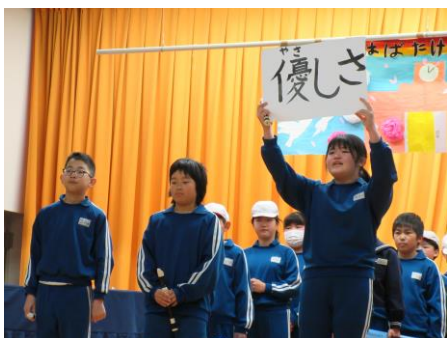
5年 『思い出クイズ ～今までありがとうSP～』