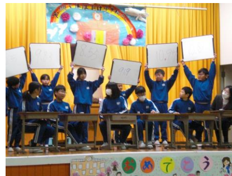
4年 『6年生、最後の思い出の1日』