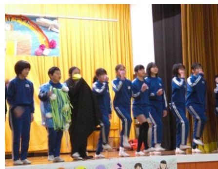
6年 『6年生の山あり谷あり 平地ありの成長ストーリー』