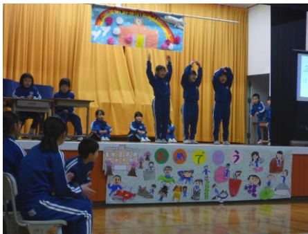
1年 『6年生へのおたのしみチャンネル』

3月3日（日）に6年生を送る会が開催されました。どの学年の発表も、6年生への感謝の気持ちがこもった心温まる発表ばかりでした。たくさんの保護者の皆さんに応援にかけつけていただき、誠にありがとうございました。