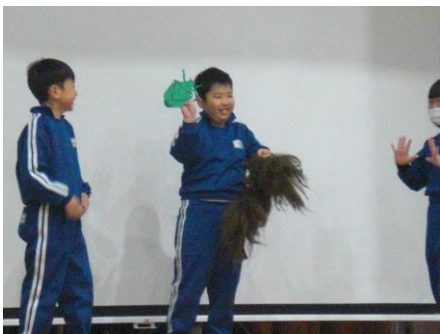
3年 『思い出 ハプニング』