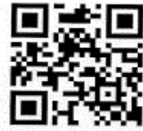
(荒土小学校ブログ)